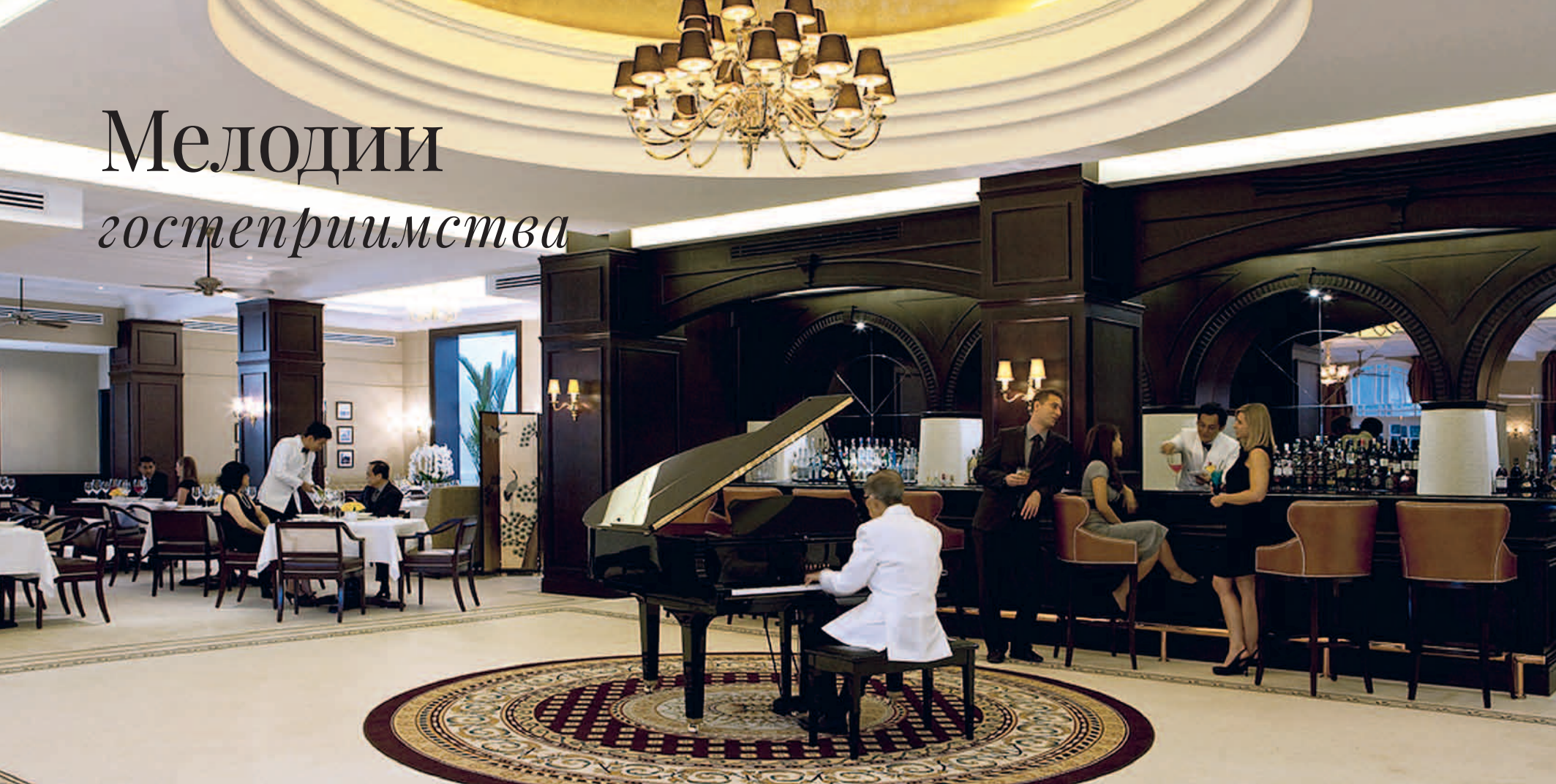
Hotel Majestic Kuala Lumpur