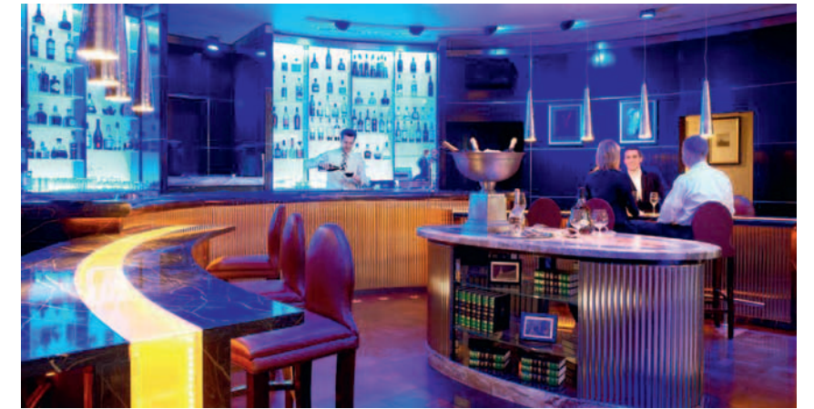
Intercontinental Москва Тверская

Музыка – это прекрасно! Она почти всегда сопровождает нас, меняет наше настроение, вызывает множество чувств. Неудивительно, что музыка в отелях – неотъемлемая часть атмосферы.