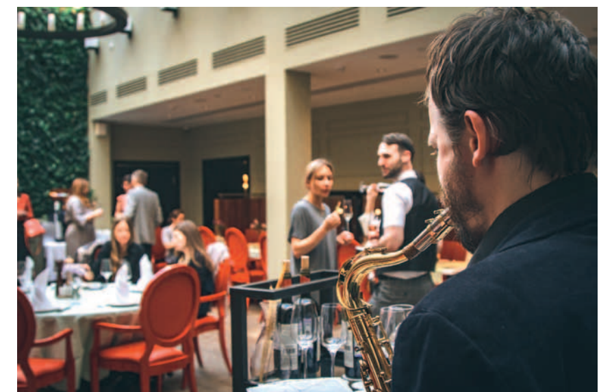
Dom Boutique Hotel

« Все в атмосфере лобби отражает, кто вы есть. »