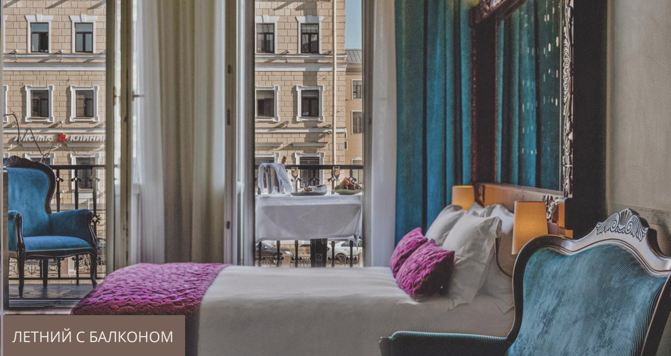
ЛЕТНИЙ С БАЛКОНОМ