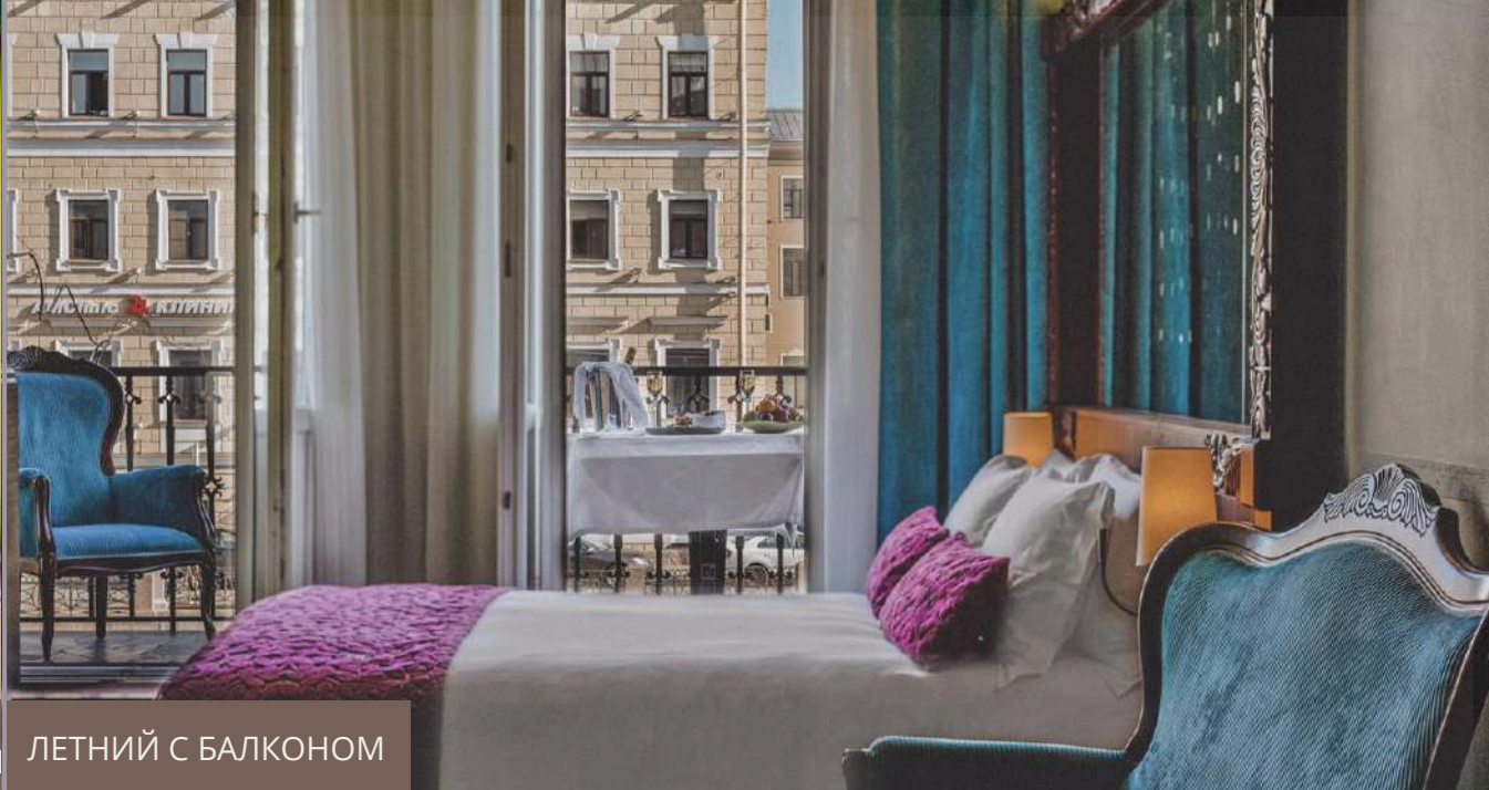
ЛЕТНИЙ С БАЛКОНОМ