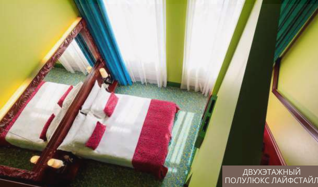
ДВУХЭТАЖНЫЙ ПОЛУЛЮКС ЛАЙФСТАЙЛ